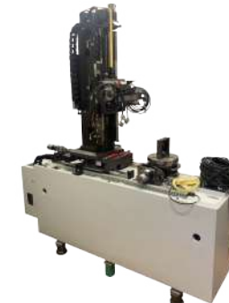
EVOLVENTIMETRO HOFLER MOD. EMZ 632

Retrofittato con controllo Liebherr, lettore Renishaw e testa di prova