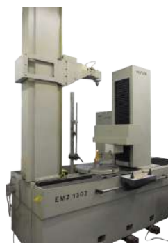
EVOLVENTIMETRO HOFLER MOD. EMZ 1302