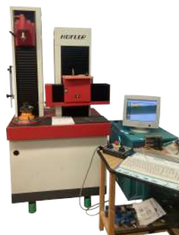
EVOLVENTIMETRO HOFLER MOD. ZME 402