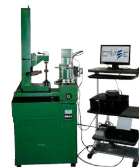
EVOLVENTIMETRO MAAG MOD. SP 60

Ø MAX=600 mm h MAX con contropunta=770 mm h MAX misurabile=150 mm