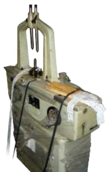
INGRANOMETRO MAHR MOD. 895 C

Ø MAX con contropunte=240 mm h MAX con contropunte=300 mm Distanza MAX tra le punte=300 mm Distanza MIN tra le punte=70 mm