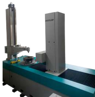
EVOLVENTIMETRO HOFLER MOD. EMZ 2602