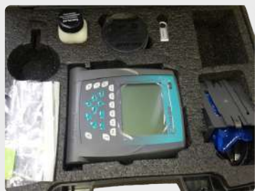
DUROMETRO LEEB MOD. EQUOTIP 3 SONDA D - G